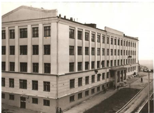
Корпус химического факультета, 1966 г.

В 1962 г. началось строительство нового корпуса химического факультета. В 1964 г. строительство было закончено, и в новый корпус переехали преподаватели и студенты химического факультета, которые до этого обучались на втором этаже правого крыла главного корпуса университета.